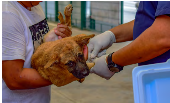
Vacunación y Desparasitación Gratuitas

Se llevo a cabo el Primer CaninoFest con temas como: Ferias de Adopción responsable, adiestramiento canino, Platicas de Tenencia, Vacunación y Desparasitación gratuitas, con una participación de 112 personas y 150 caninos, finamente se realizó la jornada de vacunación antirrábica con 1,105 dosis aplicadas.