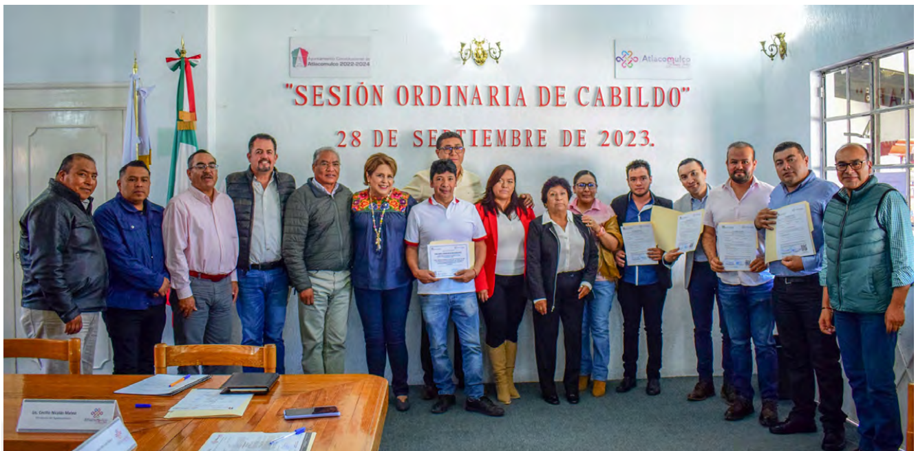
Entrega de Dictámenes de Giro

El Comité Municipal de Dictamen de Giro, con diferentes instancias de la administración municipal, siendo las responsables de realizar las evaluaciones técnicas de factibilidad a las unidades económicas, con el propósito de obtener el Dictamen de Giro, las evaluaciones técnicas de factibilidad se ratifican y validan en la celebración de las sesiones ordinarias y/o extraordinarias, según sea el tema entregándose entre el 20 de abril y 28 de septiembre de la presente anualidad se otorgaron 10 dictámenes de giro a los establecimientos que cumplieron con las normas y condicionantes municipales para la obtención y/o renovación de su licencia, dichos establecimientos fueron KENWORTH ANAHUAC, Autopartes Islas, LA TAFERNA DOS27, CASA NAPOLES, MOTOR INDUSTRY, CHEERS WINGS AND BEERS, RESTUARUNTE 1945, PESCADOS Y MARISCOS EL HUACHINANGO Y EL PRE.