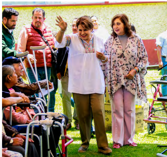
Entrega de Aparatos Funcionales

Así mismo se llevaron a cabo 992 terapias funcionales beneficiando a 470 personas, 289 terapias de lenguaje beneficiando a 100 personas, 172 terapias de estimulación temprana beneficiando a 114 personas y 5,562 terapias físicas beneficiando 1,443 personas.