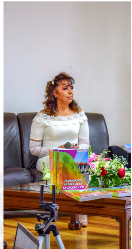
Presentación de la Monografía de Atacomulco