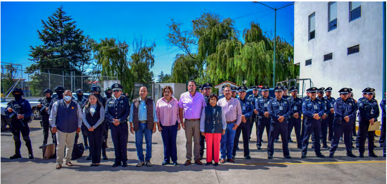
Entrega de Uniformes a Elementos de la Policía Municipal