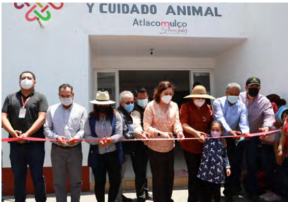
Rehabilitación del Exterior del Centro de Control y Cuidado Animal

Se realizó la rehabilitación del exterior del Centro de Control y Cuidado Animal, se rehabilitó la entrada del parque canino (herrería y soldadura), construcción de barda perimetral del Centro de Salud en la localidad de la Mesa de Chosto, con 291.M2 de construcción y una inversión de recursos FEFOM $868,867.16 y una población beneficiada 2,517 y construcción de Patio de Maniobras en el Hospital General del Instituto de Salud del Estado de México, Atacomulco con una inversión $868,867.15 y una meta 578.25 metros cuadrados beneficiando 100 personas.