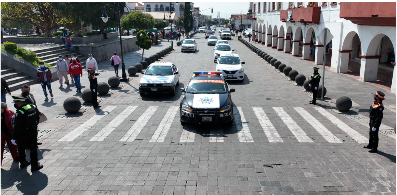
Trabajos del Departamento de Tránsito Municipal

Así mismo el Departamento de Tránsito cuenta con un formato de convenio entre ciudadanos que participaron en hechos de tránsito, el cual tiene la finalidad de prevenir algún hecho delictivo o falta administrativa ya que se exhorta a los participantes a llegar a un común acuerdo para la reparación de los daños, generando un total de 324 convenios.