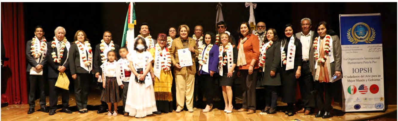
II Cumbre Mundial de Embajadores de la Paz

Con la referida promulgación "Reglamento de la Oficialía Calificadora del Municipio de Atacomulco" se dio pauta a la implementación formal del Modelo Homologado de Justicia Cívica en el municipio de Atacomulco, con lo cual se dota con nuevas facultades a los oficiales calificados para iniciar con las audiencias públicas en el procedimiento de calificación por faltas administrativas, así como para implementar las alternativas de sanciones como las medidas para mejorar la convivencia cotidiana, mismas que pueden consistir en trabajo a favor de la comunidad o canalización a centros de atención contra las adicciones, así como la implementación de audiencias públicas en los procedimientos de calificación.