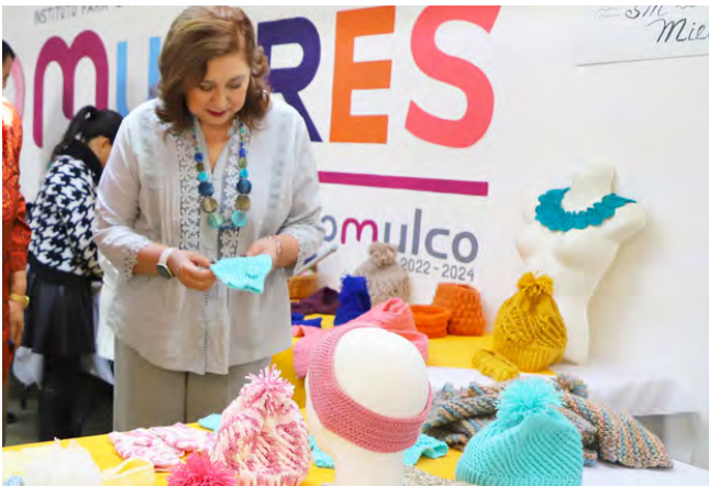
Curso "Tejiendo Ilusiones"

Se impartieron 25 talleres de capacitación para el trabajo (autoempleo y autoconsumo) beneficiando a 1,025 personas.