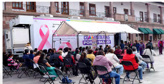
Jornada de Mastografías

En apoyo a la salud de las mujeres atacomulquenses brindándoles prevención contra el cáncer y una mejor calidad de vida, se llevaron a cabo dos Jornada de Mastografías con un aproximado de 110 personas atendidas en todo el municipio.