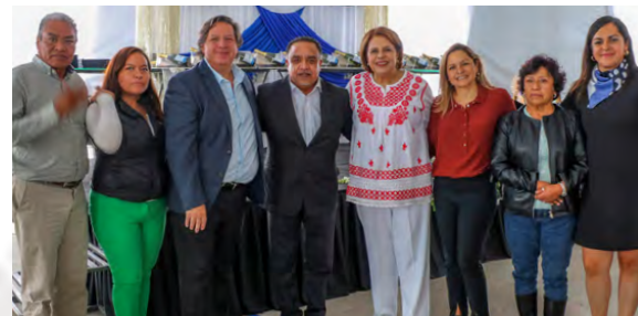
Acuerdo de Colaboración de Empresarios BRULUAGSA