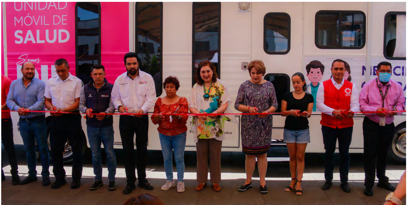
Feria de Salud

Partiendo de lo anterior y con la intención de promover la salud y detectar enfermedades crónico-degenerativas, se llevaron a cabo 5 Ferias y la Magna Feria de Salud , en la Alameda Central, en donde se ofrecieron diversos servicios como: medicina general, odontología, examen de la vista, masoterapia, auriculoterapia, acupuntura, atención contra la violencia a la mujer, rastreo de mama, citologías, detección de enfermedades crónico degenerativas, antígeno prostático, vasectomías, planificación familiar, pruebas VIH, pruebas de hepatitis, pruebas de sífilis y pláticas sobre prevención de accidentes; la cual tuvo una duración de 5 días y se reportaron un total de 8,323 servicios y 830 asistentes, para que la población del municipio cuente con un mejor nivel de vida y de calidad, así como 5 jornadas de vacunación contra VPH y neumococo para de esta manera completar el esquema de vacunación con 700 beneficiados.