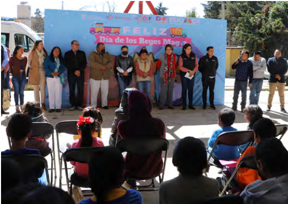
Festejo Día de Reyes

Esta administración festejó el Día de reyes y el Día del niño beneficiando a 24,685 niños de las 38 comunidades y 18 colonias.