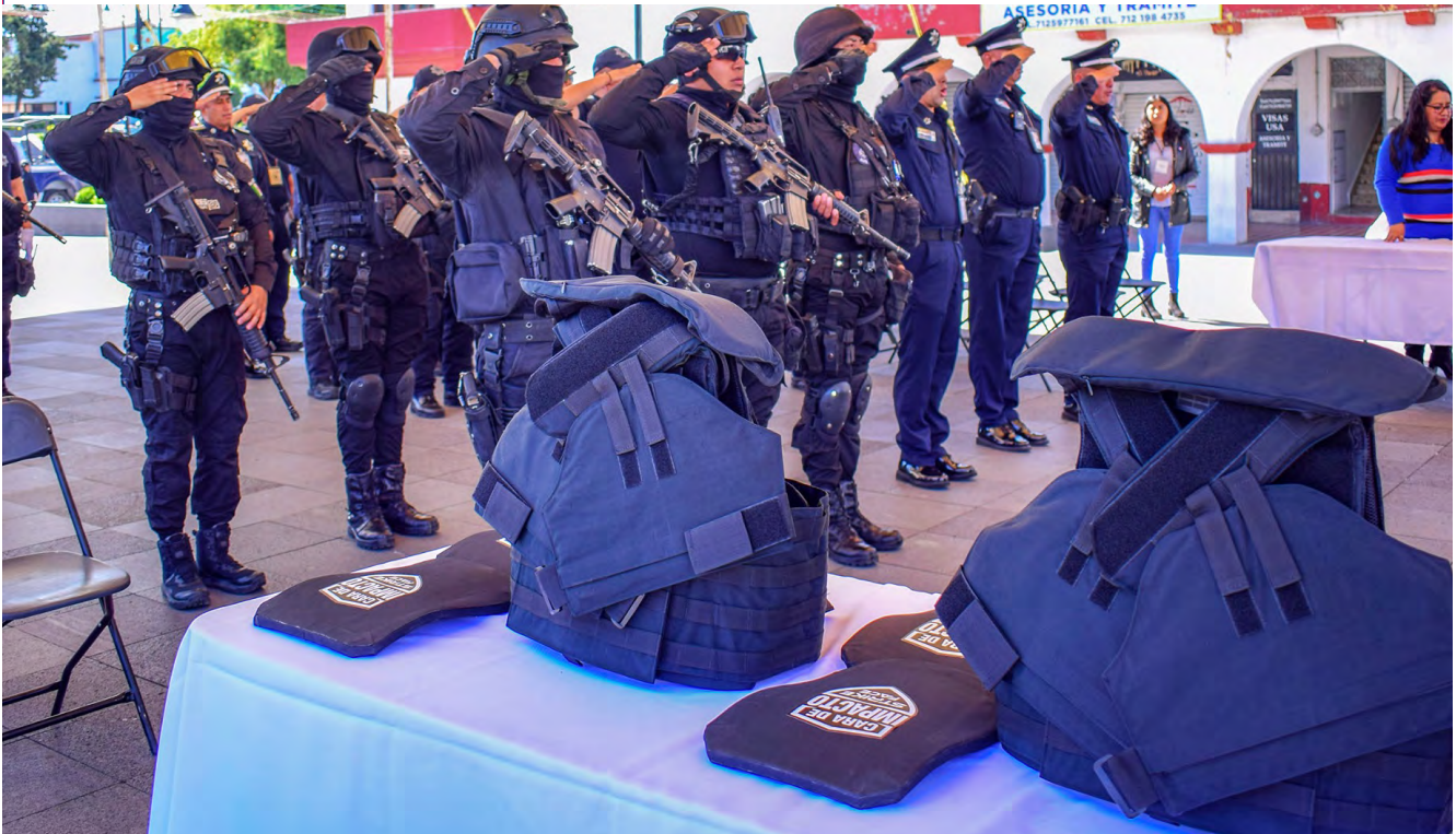
Entrega de Chalecos Antibalas