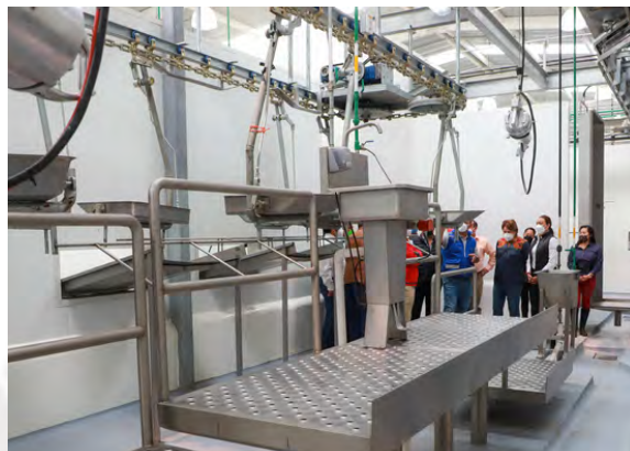
Mantenimiento Correctivo a Maquinaria del Rastro Municipal