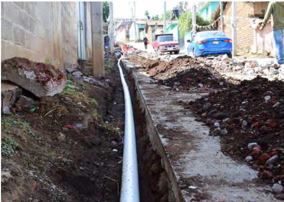
Ampliación de Redes de Distribución de Agua Potable

Ampliaciones de redes de distribución de agua potable en la comunidad de Santiago Acutzilapan, paraje el Llano, con una inversión de $168,669.75 con una meta de 360 metros lineales beneficiando a 120 habitantes, calle Sin Nombre y 16 de Septiembre con una inversión de $167,290.18 logrando una meta de 300 metros lineales beneficiando 150 habitantes, calle Libertad con una inversión de $168,123.08 alcanzando 230 metros lineales y beneficiando a 150 habitantes y calle Sin Nombre y 16 de Septiembre con una inversión de $398,958.95 logrando una meta de 270 metros lineales beneficiando 150 habitantes.