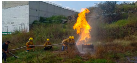
Capacitaciones de Sofocación de Incendios

Llevamos a cabo 56 verificaciones de medidas de seguridad y servicios preventivos en quemas de fuegos pirotécnicos, con personal de protección civil y ambulancia, para cualquier eventualidad ocasionada por este fenómeno.