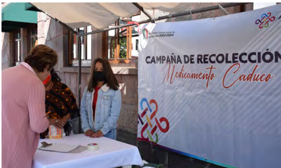
Campaña de Recolección de Medicamento Caduco

Con la intención de concientizar a la población acerca de los riesgos que implica para la salud y la vida de las personas el consumo de medicamentos vencidos, efectuamos dos Campaña de Recolección de Medicamentos Caducos, recolectando cerca de 384 kilogramos de medicamentos.