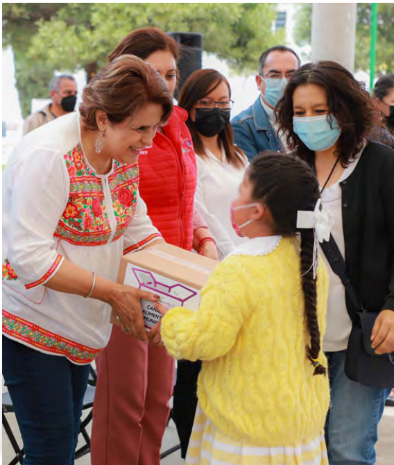
Entrega de Canasta Alimentaria

A través del programa Unidades Productivas del Sistema Municipal para el Desarrollo Integral de la Familia se establecieron 903 huertos familiares beneficiando a 900 Familias, se distribuyeron 1,215 paquetes de semillas para 2,546 personas y se proporcionaron 167 pláticas de capacitación y orientación a 2,546 personas como apoyo al ahorro familiar y producción de alimentos.