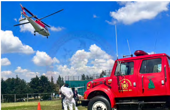
Apoyo para Traslado Aéreo

Se han atendido 54 servicios de captura de animales, posteriormente liberándolos en su hábitat natural y canalizando algunas especies a las instituciones correspondientes para la conservación de la especie, así mismo se neutralizaron y reubicaron en su hábitat natural 113 enjambres de abejas, las cuales representaban un riesgo inminente a la ciudadanía del Municipio Para capacitar y profesionalizar al personal de Protección Civil y Bomberos recibieron 33 capacitaciones con diferentes temas, por parte de la Escuela Nacional de Protección Civil a través del Centro Nacional de Prevención de Desastres, así mismo en el Centro de Investigación, Capacitación y Adiestramiento de Tecámac, además el área impartió 159 capacitaciones y simulacros, con los temas de primeros auxilios, evacuación, control y combate de incendios, búsqueda y rescate, a empresas, instituciones educativas, tiendas de auto servicio, comités municipales de protección civil y edificios públicos.