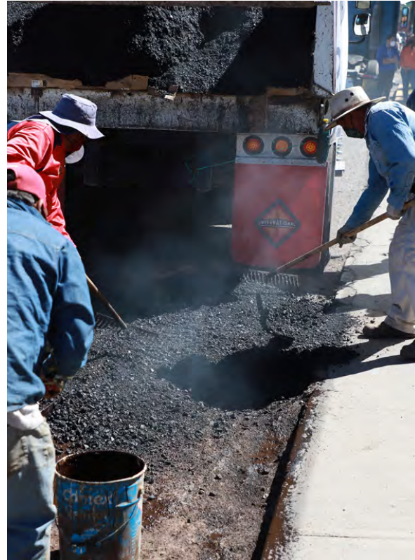
Programa de Bacheo

Con medios mecánicos además 29 áreas de uso común con limpieza de canchas, clínicas, cunetas, pintura dependiendo la actividad requerida para acondicionar el espacio público.