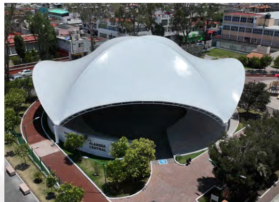
Rehabilitación de la Alameda Central

Construcción de Delegación Municipal de la localidad de Tierras Blancas, Atacomulco con recursos del FEFOM $1,500,000.00, con una meta de 134.87 metros cuadrados beneficiando a 796 personas.