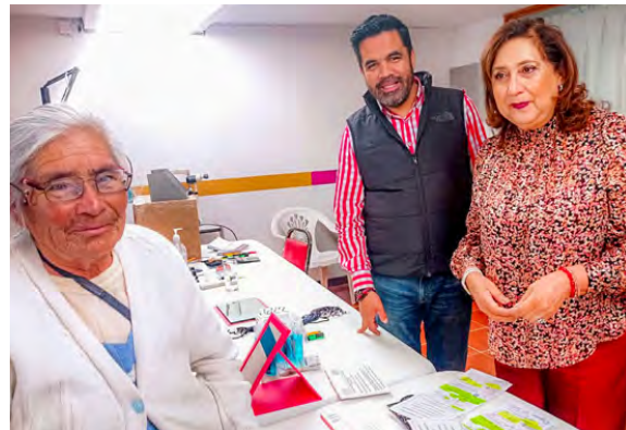
Campaña de Salud Visual

Un tema primordial para este municipio es la salud visual por ello, se llevaron a cabo 14 Campañas de Salud Visual, beneficiando a 14 colonias y 12 comunidades del municipio; con un total de 900 personas beneficiadas.