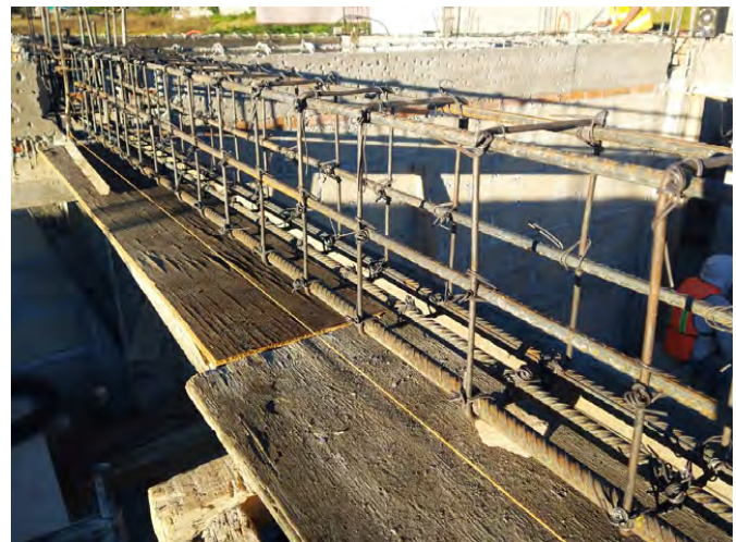
Construcción de la Delegación Municipal en la Localidad de Tierras Blancas