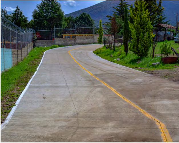
Inauguración de Calle en San Antonio Enchisi