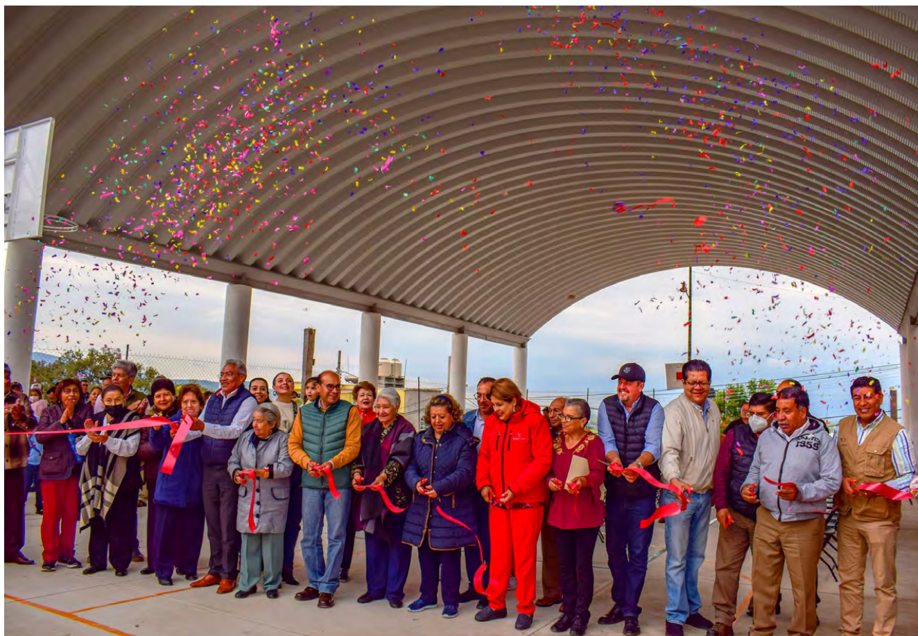
Arcotecho en la Colonia el Calvario