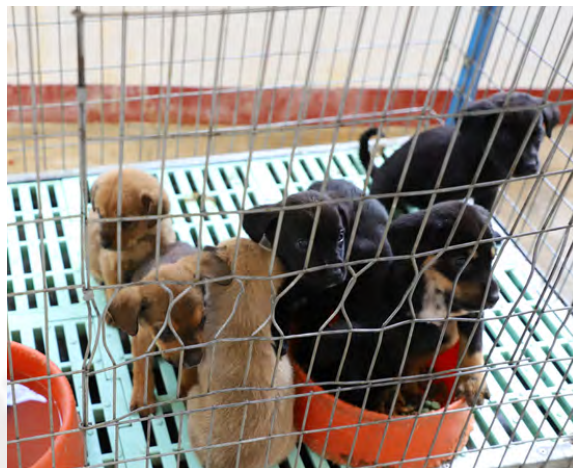
Ferias de Adopción