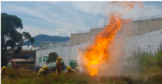
Sofocación de Incendios

Contar con los requerimientos en materia de riesgos permitirá que el Municipio responda de manera inmediata y adecuada a los desastres y perturbaciones que tengan impactos en las viviendas, infraestructuras, población y en las actividades socioeconómicas. La gestión de riesgos entonces deberá procurar la capacidad para anticipar, prevenir, absorber, recuperarse de golpes, tensiones y mejorar los servicios básicos esenciales de respuesta, integrando los diferentes aspectos de urbanización, sostenibilidad, desarrollo y el cambio climático.