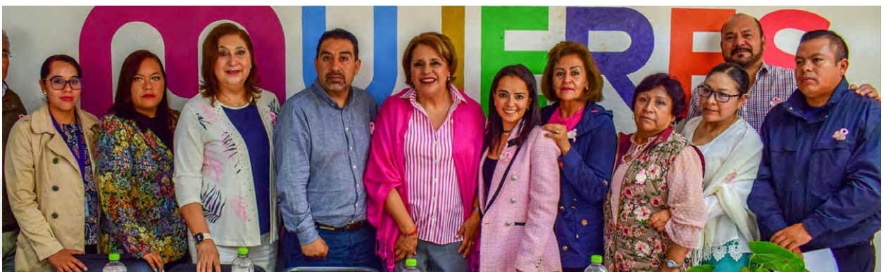
Vigésima Segunda Sesión Ordinaria del Sistema Municipal para la Igualdad de Trato y Oportunidades entre Mujeres y Hombres y para Prevenir, Atender, Sancionar y Erradicarla Violencia Contra las Mujeres