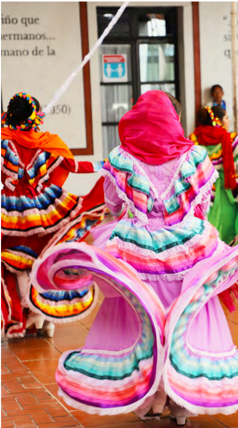
Ballet Folklórico de Atlaconomulco

Se efectuó la composición del Himno Municipal de Atlaconomulco, así como la reorganización y ajuste del evento en conmemoración al "Día internacional de la Danza", se realizó curso de teatro para el personal de la Coordinación de Bibliotecas, proyecto híbrido "Bodas Turísticas / Turismo de Romance" con el titular de Turismo y Registro Civil, rehabilitación de la Velaría del Foro al Aire Libre en la Alameda Central, Festival Los Geranios Fabelianos, Día internacional de la Danza con 20 grupos participantes y un total de 492 bailarines, Curso de Verano en las bibliotecas de comunidades y cabecera teniendo un total de 332 beneficiados, Festival Cultural Ambaró 2023 y Evento Atlaconomulco se viste muy mexicano con 500 asistentes.