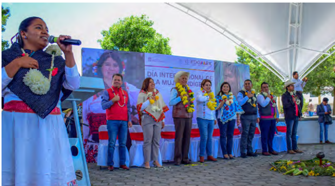
Día Internacional de la Mujer Indígena

Se realizó el Segundo Festival Intercultural Indígena en Atacomulco, con la intención de salvaguardar y exaltar nuestra cultura originaria efectuándose 4 eventos culturales, en el cual se celebra la cultura e identidad de cada uno de nuestros pueblos originarios, los cuales juegan un papel clave en la preservación de los usos y costumbre de nuestra comunidad, teniendo un aproximado de 600 asistentes. Acompañada de danza, poesía y con la finalidad de reavivar nuestras tradiciones.