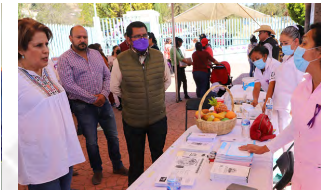
Jornadas de Atención Médica, Psicología y Nutricional