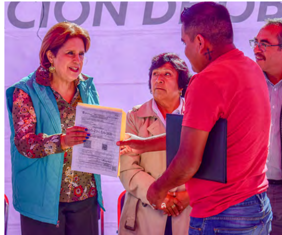
Entrega de Licencia de Funcionamiento de Panteón

Así mismo están en proceso los panteones de Tecoaac, San Felipe Pueblo Nuevo y el Ejido del Rincón de la Candelaria.