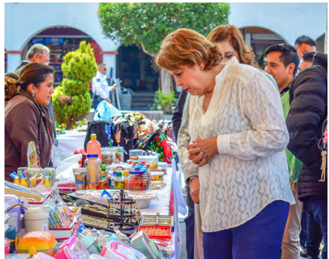
Feria del Emprendedor

Se llevaron a cabo la Feria del Emprendedor, Expo-Emprendedores y de un Kiosco del Emprendedor beneficiando a 2,000 personas.