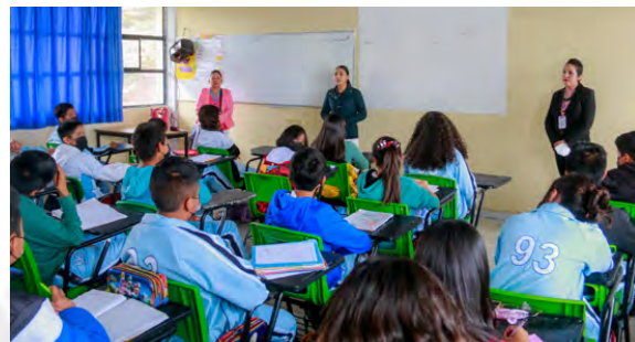
Pláticas de Concientización de Desarrollo Humano

Considerando la actividad primordial que se realiza en la Estancia Infantil donde se ha brindado atención a 78 niños y niñas, hijos de madres trabajadoras en situación vulnerable, abriendo espacios a pequeños con alguna discapacidad, contado también con 79 platicas de salud física y mental y de nutrición, 26 eventos escolares, 10 actividades cívicas todo con el fin de lograr un desarrollo armónico en los niños, actividades que involucran a familiares, padres de familia, niños y personal de la institución.