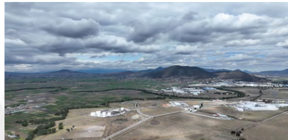
Zona Industrial de Atacomulco