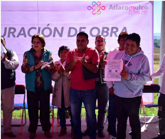
Entrega de Licencia de Funcionamiento de Panteón