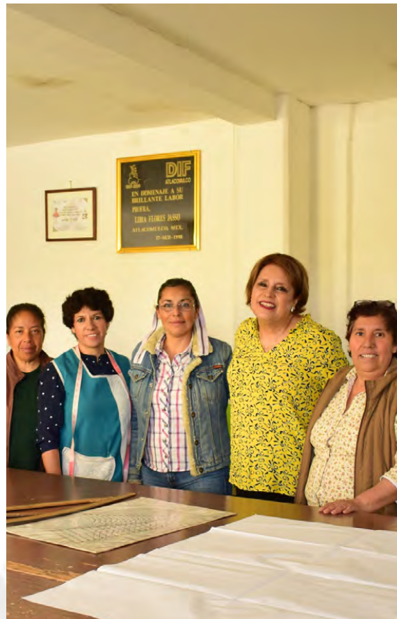
Curso de Corte y Confección