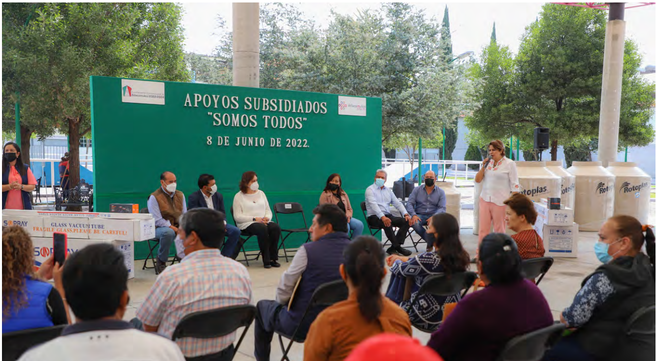
Entrega de Apoyos Subsidiados "Somos Todos"

Con el objetivo de ofrecer a la ciudadanía en general del Municipio de Atlacomulco, apoyos a la vivienda a un menor costo del que se encuentra en el mercado, se crea el Programa "Apoyos Subsidiados, "Somos Todos", en el cual se brinda a la ciudadanía en general el acceso a bienes y servicios básicos, tales como: láminas plastificadas, herramientas de trabajo, parrillas, calentadores solares, tinacos, desbrozadoras y artículos en paquete beneficiando a 50 familias.