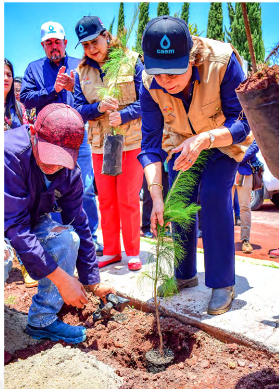
Programa de Reforestación

La Dirección de Ecología ha publicado dos números de su revista, en la que se han dado a conocer a la ciudadanía los Proyectos que se llevan a cabo, con motivo del cuidado del medio ambiente como el Decálogo de buenas prácticas que invita a la ciudadanía a sumarse a tareas como la economía circular, la correcta separación de residuos sólidos para la disminución de su acopio, un panorama general de los beneficios de la instalación de jardines polinizadores en el Municipio con excelentes resultados, por lo que, 3 instituciones educativas los han instalado en sus centros educativos.