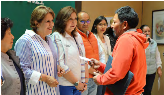
Credencialización a Artesanos

Se realizaron 2 eventos orientados a impulsar el consumo local y promover el apoyo a jóvenes emprendedores del municipio (Cupones de descuento en negocios de emprendimiento local y un concurso con motivo de San Valentín).