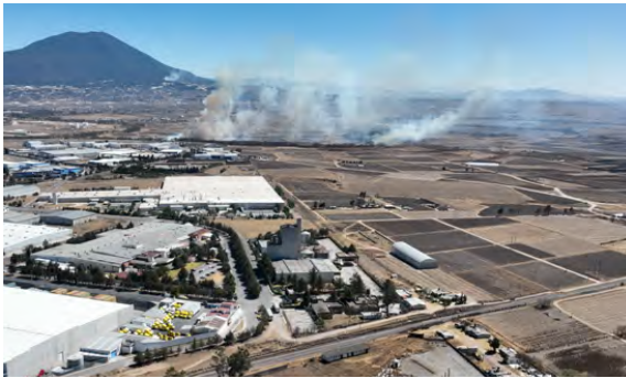
Incendio Atendido por Protección Civil y Bomberos

1,038 atenciones prehospitalarias, este servicio se brinda cuando es solicitado vía telefónica por la ciudadanía, 144 traslados foráneos a la Ciudad de México y Toluca, así como a Municipios aledaños a personas de escasos recursos con enfermedades crónicas con previa programación, 367 ingresos locales a personas a Hospitales y 156 apoyos extraordinarios, los cuales son solicitados por las Instancias Gubernamentales y Sector Privado.