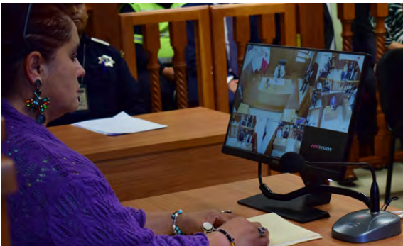
Sala para Juicios Orales

Las construcciones realizadas para mejorar el servicio público de seguridad pública en la comunidad de San Juan de los Jarros fue la construcción de Módulo de Seguridad Pública con una inversión de $ 868,867.16 de recursos del programa FEFOM, con una meta de 91.56 metros cuadrados, beneficiando 2,260 personas y en la comunidad de Santiago Acutzilapan $ 868,867.15 de inversión del mismo programa 91.56 metros cuadrados construidos de este módulo y beneficiando a 7,364 habitantes.