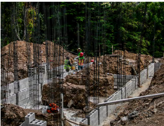
Construcción del Centro de Atención Integral de Personas Adultas Mayores en el Rincón de la Candelaria