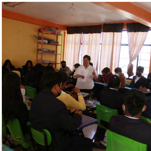
Pláticas y Talleres de Salud Mental

La Salud mental de los Atacomulquenses también preocupa y ocupa al Sistema Municipal para el Desarrollo Integral de la Familia por ello se han otorgado 917 consultas psicológicas y se ha impartido 59 pláticas y talleres de salud mental a 2,251 personas.