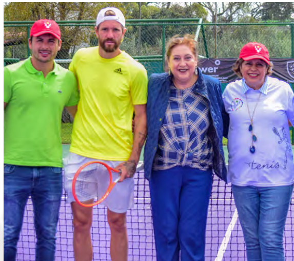
Abierto de Tenis