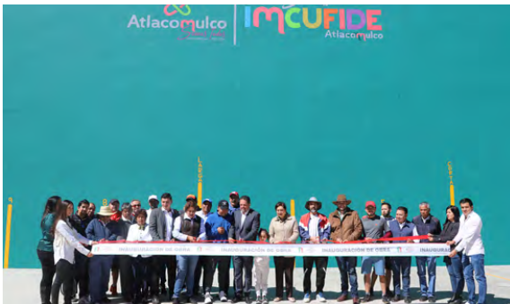
Rehabilitación de la Cancha Deportiva de Frontón

Así como la realización del Primero Abierto de Tenis en el municipio de Atacomulco. Se rehabilito las canchas del frontón y frontenis, así mismo, se renovó en su totalidad el sistema de riego en el estadio municipal de Atacomulco y bombas para el filtrado de agua en las albercas del parque las fuentes.