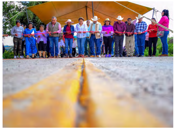
Inauguración de Calle en Bobashi de Guadalupe