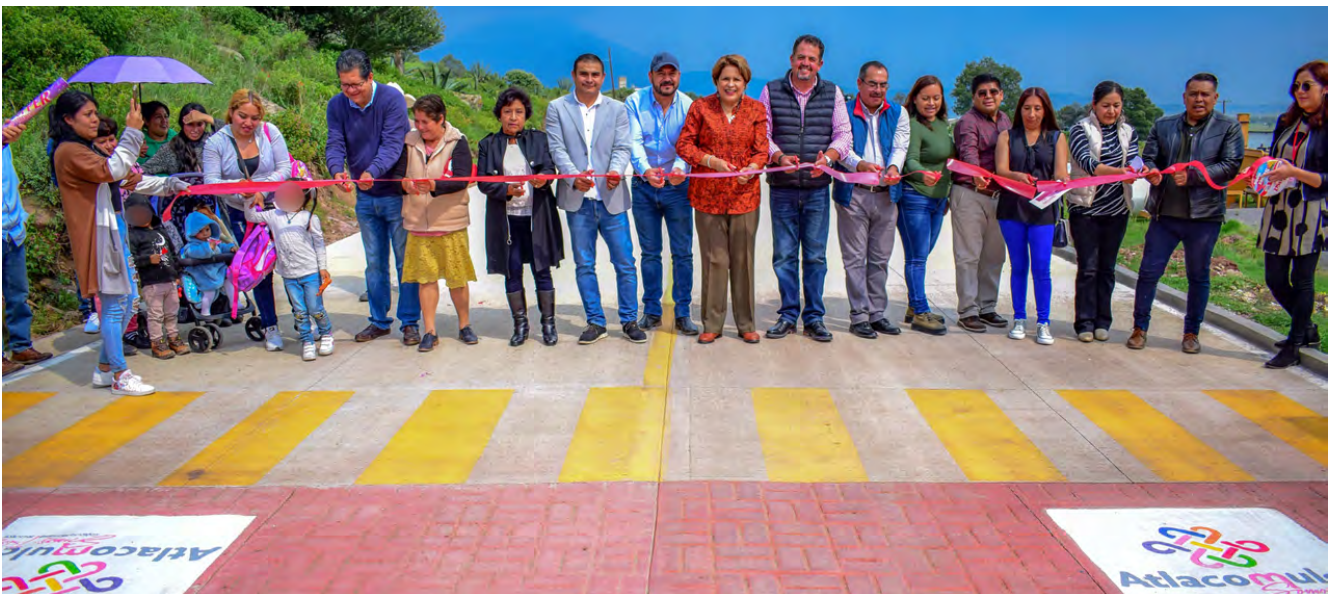
Inauguración de Calle en la Col. 2 de Abril