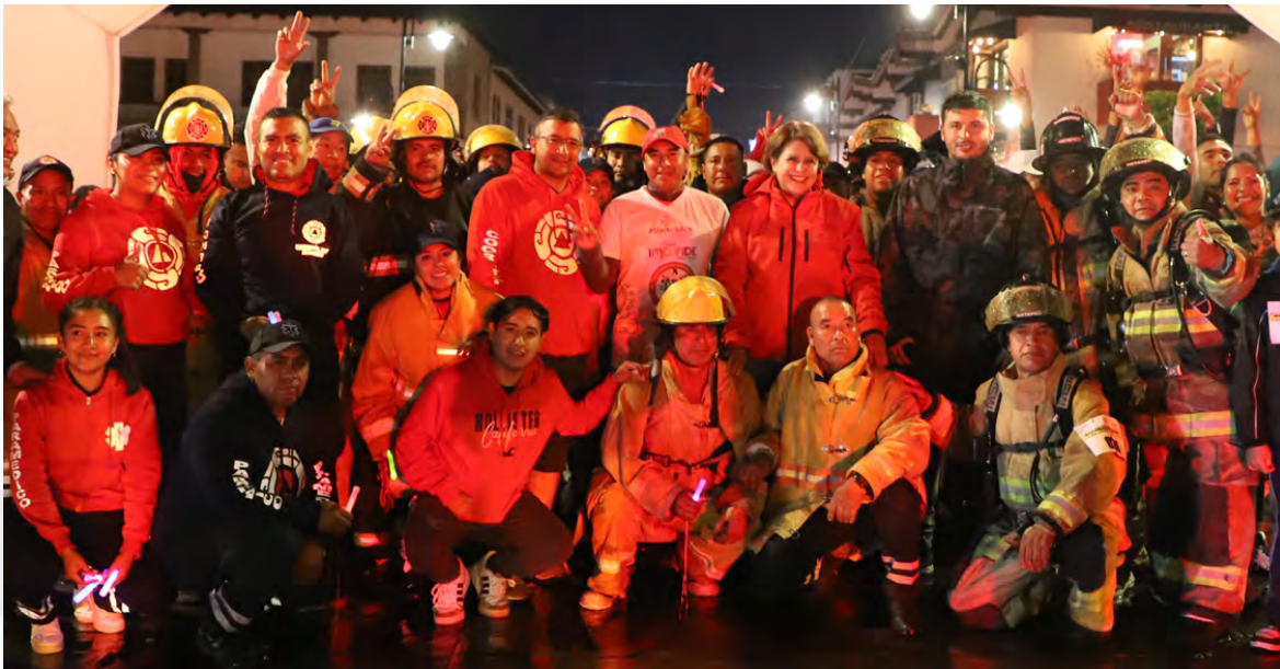
Carrera Atlética de Bomberos

Partiendo de lo anterior se ha realizado las actividades siguientes: Se les han brindado 10 apoyos a los siguientes Municipios: San Felipe del Progreso, Acambay, Temascalcingo, Jilotepec y Jocotitlán para sofocar incendios industriales, incendios de hacinamiento, preventivos en eventos masivos y traslados, 11 servicios de incendio de casa habitación, en las Colonias, Centro, San Martín, Las Mercedes y Isidro Fabela, en las comunidades de San José Toxí, San Lorenzo Tlacotepec, Tecuac, Rincón de la Candelaria y San Bartolo el Arenal, de los cuales únicamente se registraron daños materiales, así como 43 incendios populares, la mayoría fueron a consecuencia de la quema de basura y desechos de materiales, 3 incendios de hacinamiento, en la Comunidad de San Antonio Enchisi, Ejido de San Francisco y en la Comunidad de San Pedro el Alto, Municipio de San Felipe del Progreso, 5 incendios comerciales, 23 servicios de incendio de vehículos, causados por cortos eléctricos y ruptura en las mangueras de gasolina.