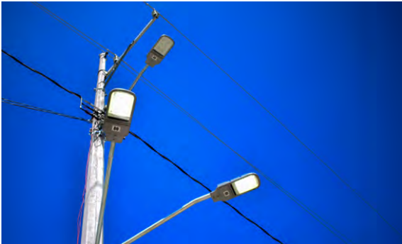
Ampliación de Redes de Electrificación

La Coordinación de alumbrado Público realizó la instalación de 365 lámparas de 55 watts y 300 lámparas de 60 watts en las diferentes colonias de la cabecera municipal y comunidades para brindar mayor seguridad a la población atacomulquense.