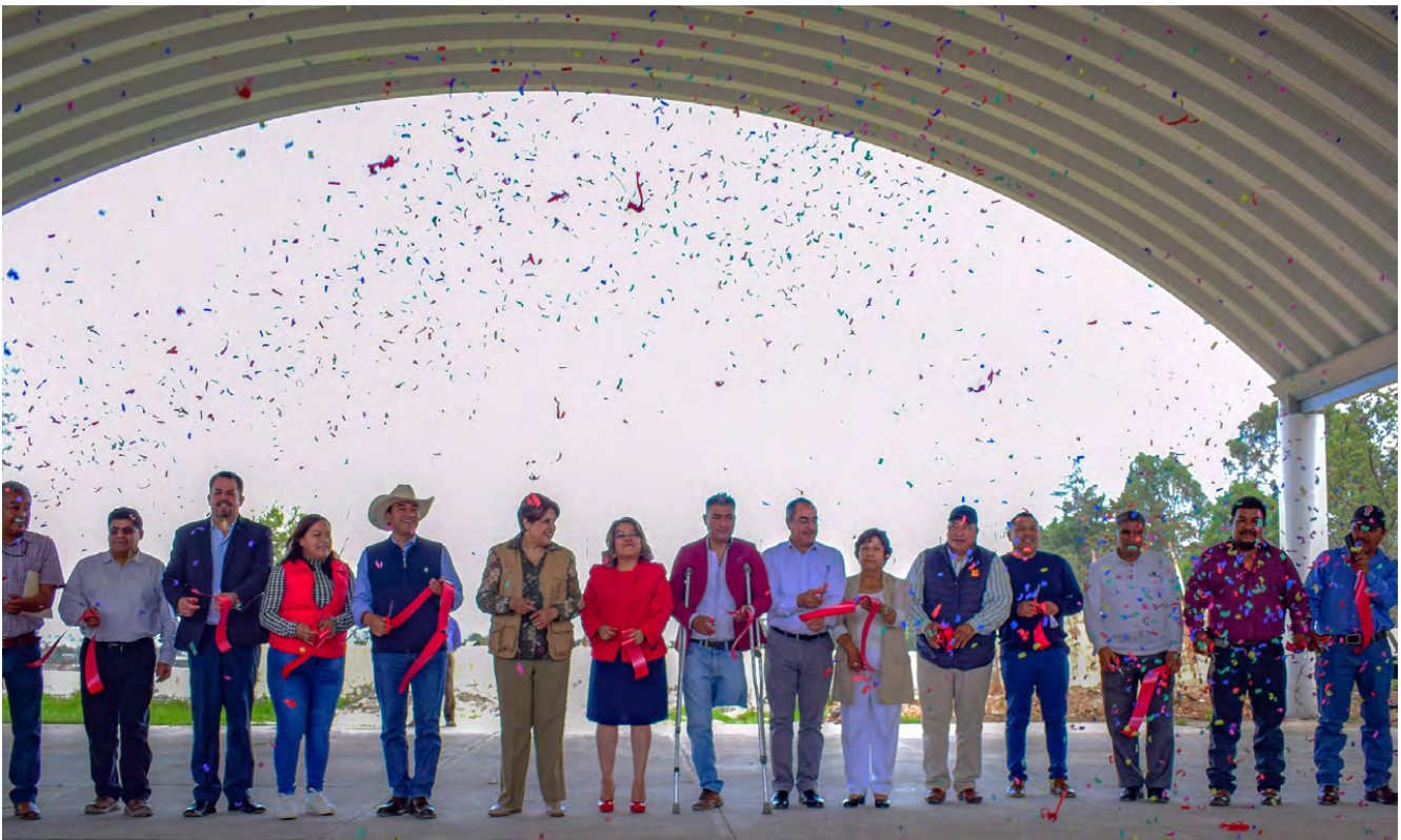
Arcotecho en Escuela Secundaria de la Mesa de Chosto

En la comunidad de Manto del Rio Pueblo se construyó la Barda perimetral de la Escuela Primaria "Tres Poderes" con recursos FAISMUN $ 599,741.56 y logrando un meta de 91.80 metros lineales, beneficiando a 150 alumnos para brindar seguridad del inmueble y personas que lo ocupan.