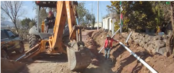
Trabajos de Líneas de Distribución del equipo O.D.A.P.A.S.

Se repararon 1,057 fugas de agua potable que se presentaron en la Cabecera Municipal y comunidades, en tomas domiciliarias, líneas de distribución y conducción, 36 mantenimientos a los equipos de bombeo y rebombeo eficientemente, 106 instalaciones de tomas de agua potable en Cabecera Municipal y comunidades 9,083.5 metros lineales de rehabilitación de redes de distribución y conducción de agua potable, instalación de 58 medidores para agua potable, 12 mantenimientos electromecánicos a instalaciones y equipos de la Planta Tratadora de Aguas Residuales y cárcamo de bombeo de aguas residuales, aplicación de 1,360 Kg (cloro gas) en cloración de agua tratada (efluente) de la Planta Tratadora de Aguas Residuales.