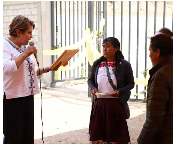
Entrega de Licencia de Funcionamiento de Panteón