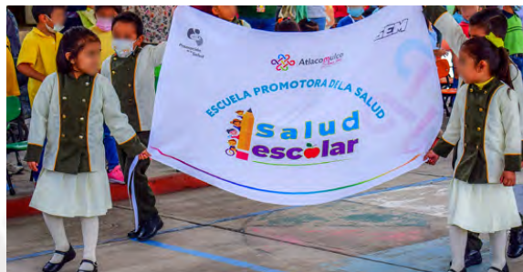
Certificaciones de Escuelas Promotoras de Salud