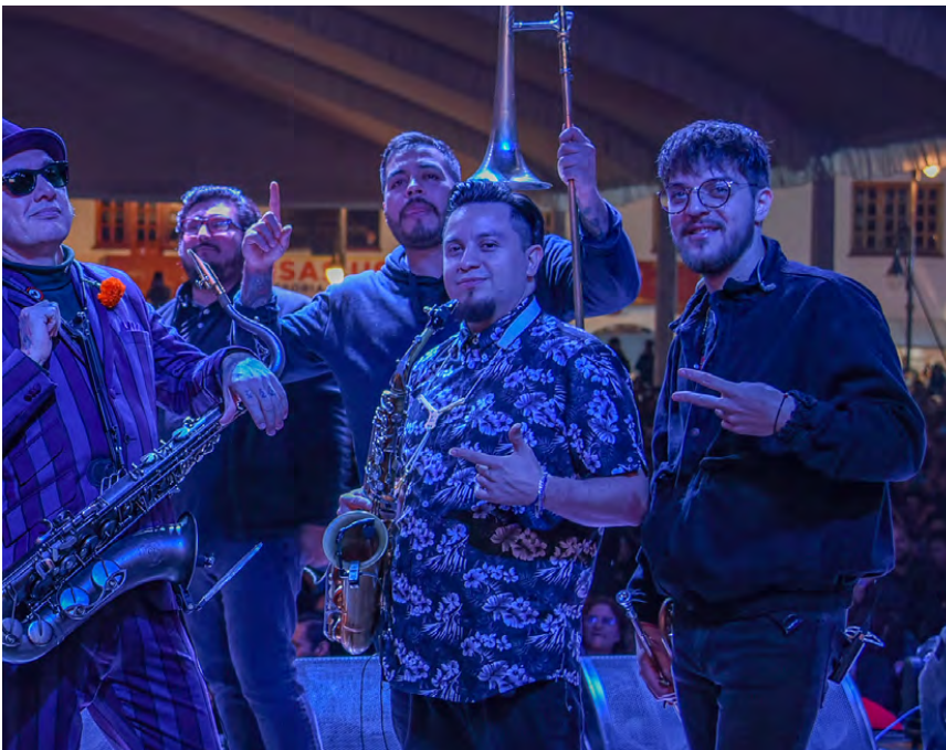
Grupo Inspector en el Festival Cultural Ambaró 2023

Es menester recalcar la construcción del Centro Cultural y Artístico, ubicado en la colonia el Jazmin, por un monto de $4,022,793.85 del fondo del FAISMUN y una meta de 225.81 metros cuadrados beneficiando a 1,000 personas.