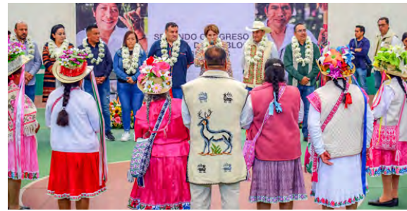
Segundo Congreso Estatal de Pueblos Originarios

Para enseñar, fortalecer y preservar nuestras tradiciones, se colaboró con la Primaria "Henri Ford" para la realización de la Semana Cultural Indígena, la cual tuvo una duración de 4 días, con un aforo de 350 personas y donde se realizaron las siguientes actividades Ceremonia de los 4 Rumbos para la inauguración, ceremonia tradicional mazahua para la clausura, elaboración de 7 diferentes tlalmanalis, elaboración de artesanías representativas de nuestra cultura (rosarios de flores) y 6 Talleres de Lengua Mazahua impartido a 240 alumnos.