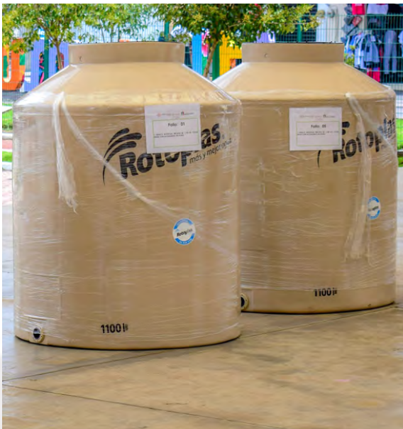
Entrega de Apoyos de Tinacos

A través del programa entrega de tinacos para poder contar con mayor captación de agua en las viviendas del municipio se entregaron 2,072 tinacos adquiridos con recursos propios y beneficiando a un total 8,288 personas.