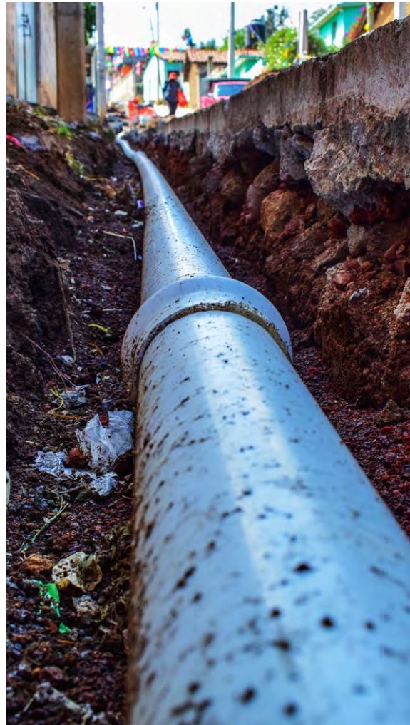
Ampliación de Redes de Distribución de Agua Potable

Construcción del drenaje sanitario segunda etapa de la comunidad de San Bartolo el Arenal por un monto de $1,024,971.52 del fondo FAISMUN con una meta de 370 metros lineales beneficiando a 75 personas.