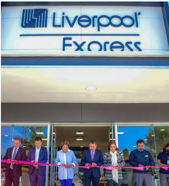
Inauguración de Liverpool Express

Finalmente se colocaron y renovaron 259 de Anuncios Publicitarios.