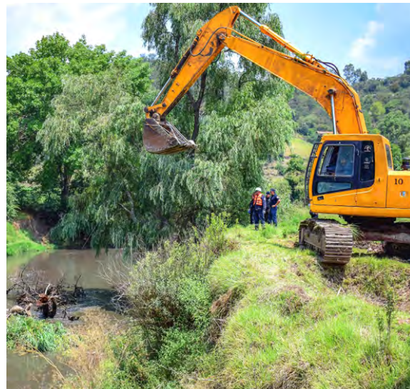
Trabajos de Desazolve del Río Lerma