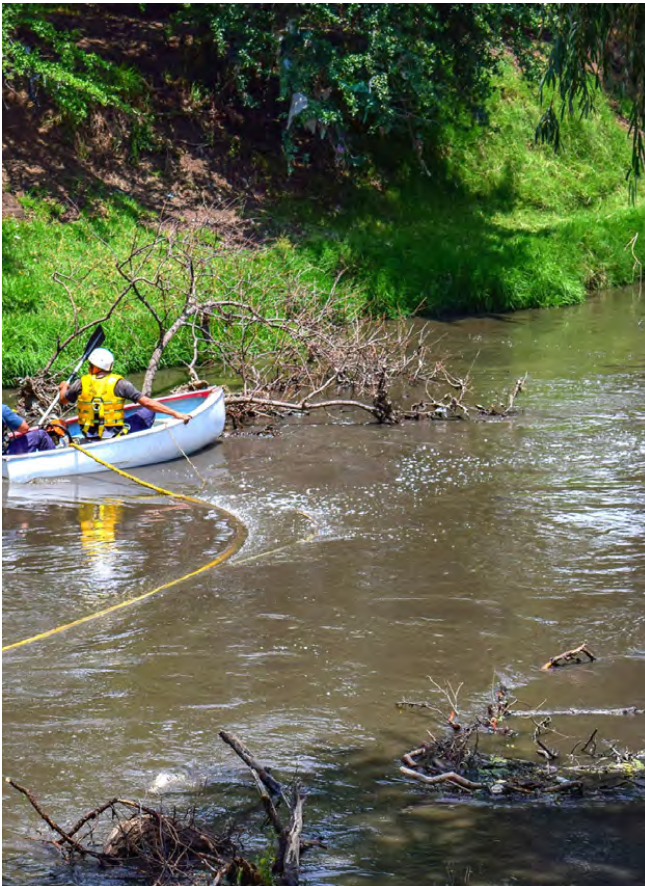
Trabajos de Desazolve del Río Lerma

Por parte de la Coordinación de Asuntos Agrarios se brindó asesoría para la gestión de trámites agrarios a 60 personas, 30 trámites ante el Registro Agrario, 10 Jornadas Agrarias y 20 citas de trámites agrarios.