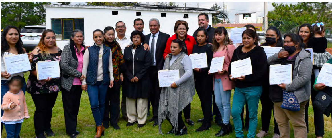
Proyectos Productivos para Mujeres en la Comunidad de Cuendo