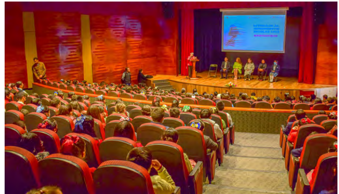
Estímulos al Rendimiento Escolar 2023