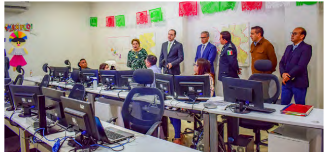
Instalaciones del C2

Personas puestas a disposición al oficial calificador por alguna falta 910 y a disposición del ministerio público 141, por último, el servicio de vigilancia en diligencias de carácter judicial 138 como apoyo entre instituciones.