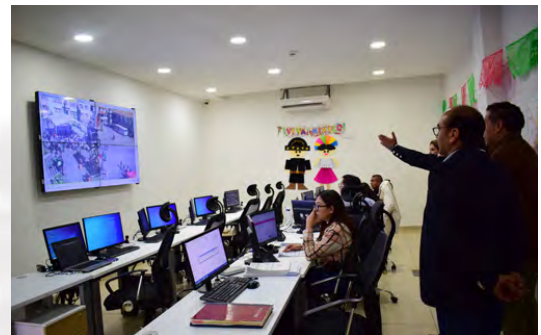
Trabajos de Vigilancia en el C2