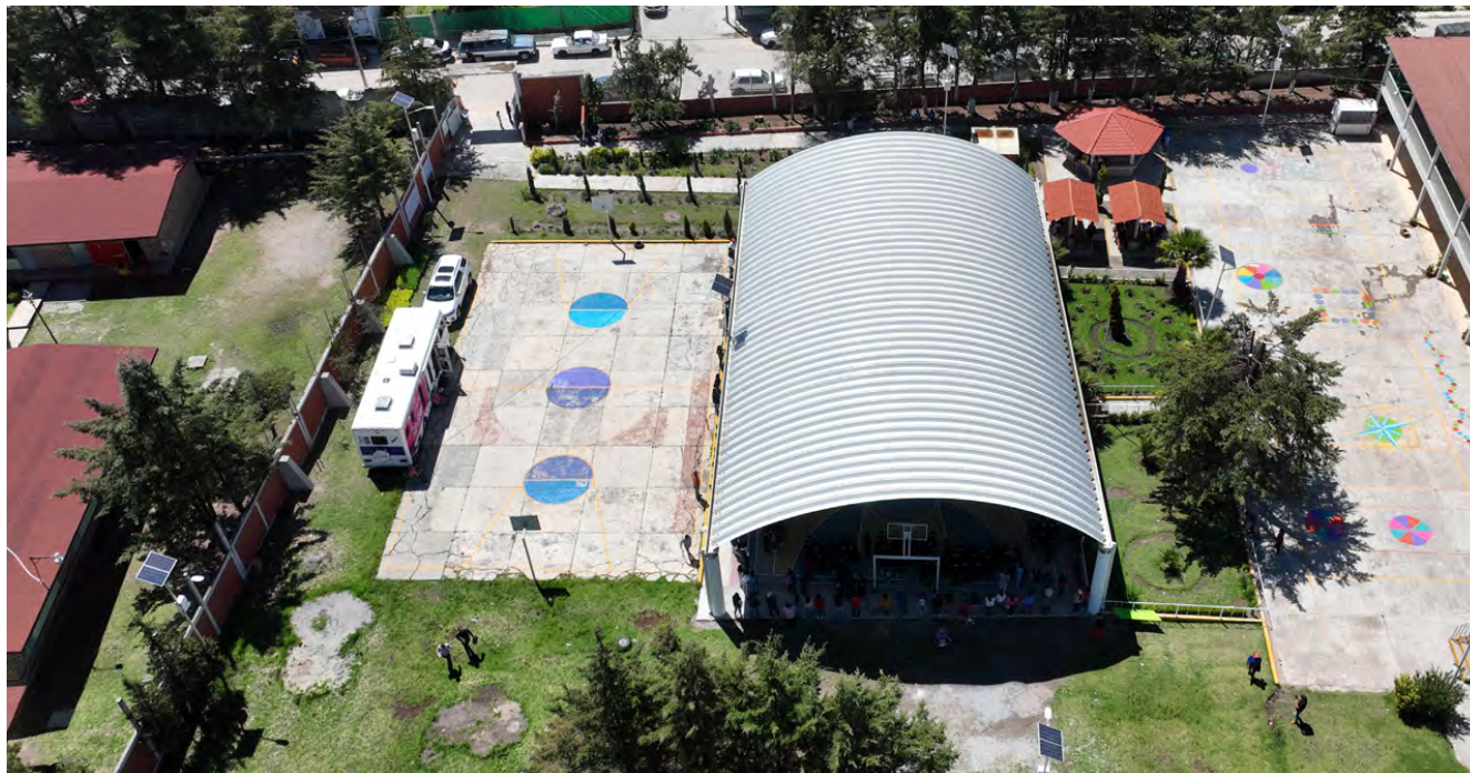
Arcotecho Escuela Primaria en San Lorenzo Tlacotepec