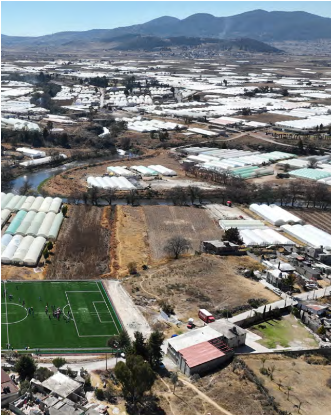
Unidad Deportiva en San Lorenzo Tlacotepec

Construcción de la Techumbre del Lienzo Charro "Gregorio Mercado Monroy" en la zona industrial de Atacomulco con una inversión de $2,000,000.00 con recursos provenientes del PAD, con una meta de 567.84 metros cuadrados beneficiando al total de la población.