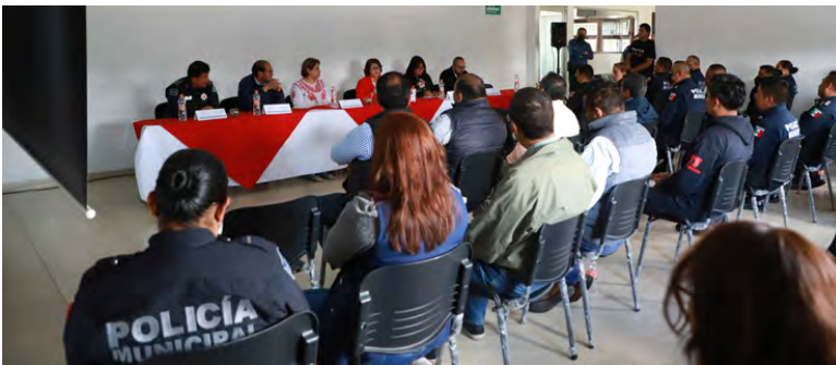
Capacitación a Policías Municipales