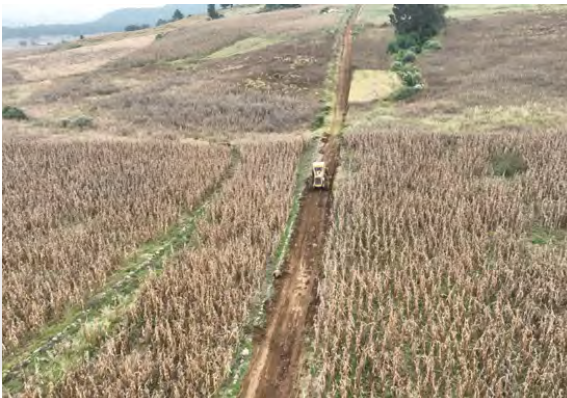
Rehabilitación de Caminos Sacacosechas en San Felipe Pueblo Nuevo

A través del Departamento de Desarrollo del Campo se han llevado a cabo las siguientes acciones: Rehabilitación de caminos sacacosecha con un total de 178.5 kilómetros, en las siguientes comunidades: Bobashi de Guadalupe, Chosto de los Jarros, El Rincón de la Candelaria, San Bartolo el Arenal, San Lorenzo Tlacotepec, San José del Tunal, Santiago Acutzilapan, San Luis Boro, San Felipe Pueblo Nuevo, San Lorenzo Tlacotepec, La Mesa de Chosto, La Palma, San Juan de los Jarros, Tecoaac, El Salto, San Antonio Enchisi, San Pablo Atotonilco, San Francisco Chalchihuapan, Manto del Río, Manto del Río Pueblo, Cuendo, San Martín de los Manantiales.