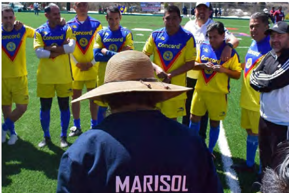
Participación de Ex jugadores Profesionales del Club América