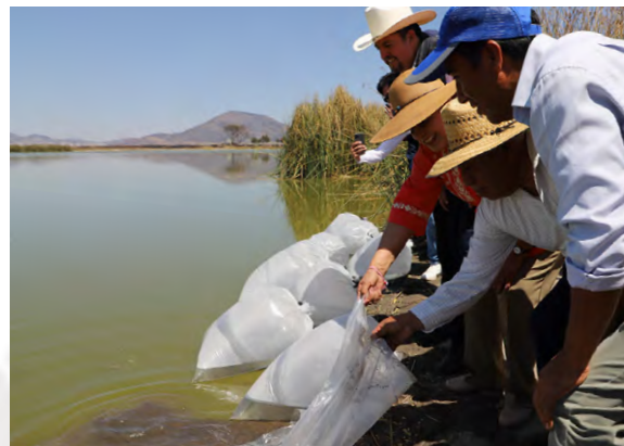
Siembra de Alevines