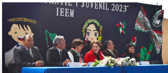
Consulta Infantil y Juvenil 2023 IEEM