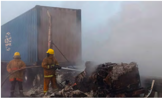
Atención de Sofocación de Incendios

Atendimos 357 hechos de tránsito, sobre Circuito Vial Jorge Jiménez Cantú y carreteras aledañas al Municipio, resultando personas lesionadas y occisas, trabajando en Coordinación con la Comisaria Municipal, Guardia Nacional, Secretaria de Seguridad del Estado de México, S.U.E.M. y Cruz Roja Mexicana, 439 acciones preventivas que se realizaron en las colonias y comunidades, por la concentración masiva de personas, en eventos sociales, religiosos, culturales y deportivos, que pongan en peligro su integridad física.