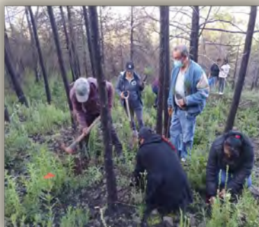
Campana de reforestación en el ejido de Bombatevi, julio 2022

I.- Pláticas de concientización con instituciones educativas, empresas, público en general sobre el desarrollo sustentable.