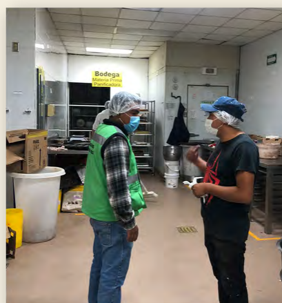
Inspección, año 2022

V.- Acudir con el personal del Comité de Dictamen de Giro, a las inspecciones y/o supervisiones colegiadas que se realicen en los giros comerciales, presidido por la Dirección de Desarrollo Económico y las demás áreas involucradas del Ayuntamiento.