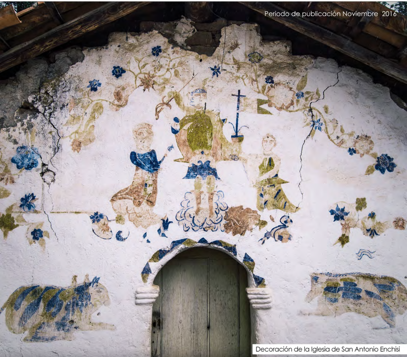
Decoración de la Iglesia de San Antonio Enchisi